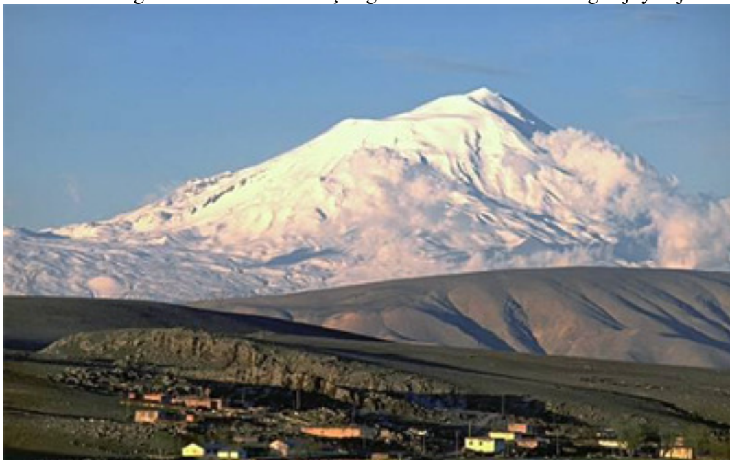
Dîmenek ji çiyayê Agirî

Herêma çiyayê Agirî û derdorên wî ew herêm bi xwe ye ku pêşiyên Kurdan (Horî, Xaldî, Manî û Mîdî) lê rûniştibûn, pêş ku Faris padîşahiya Madan sala 550-î b.z. dagîr bikin. Heya niha jî Kurd li piraniya herêmên wî rûniştine, tevî ku beşek ji wan bi encama siyaseta sazûmanên serdar bûn Ermen, Faris û Turk. Ji ber ku Kurdistan dagîrkirî û beşkirî ye, herêmên wê li gor dewletên ku ew beş dagîrkirine tên naskirin û Agirî jî yek ji wane.