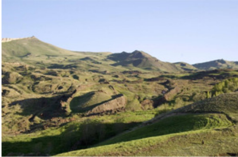
Dîmenek ji çiyayê Cûdî