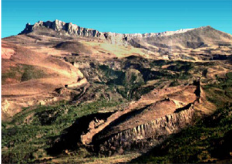
Dîmenekî din ji çiyayê Cûdî. Tê gotin ku ev dirûvê di çiyayî da mîna keştiyan ji bermayê keştiya Nûhe. Lê em bawer dikin ku diyardeyeka surîştî ye

Erdnîgarînas Al Meqdisi dibêje ku "bajarê yekem li Cizîra Botan hatiye girtin, bajarekî mezin, av ji sê aliyan va li dora wî digere û Dijle di navbera wî û çiyana da ye. Ev bajarekî xweşe, avahiyên wî ji kevirin". Yaqût El Hemewî jî dibêje: "Al Cûdî: Ev çiyayeke li hafa Cizîra Botane, li aliyê rojhilat yê Dijleyê, li derdorên Mûsilê ye. Li ser wî keştiya Nûh eleyhî selam rawestiyaye" 8 .