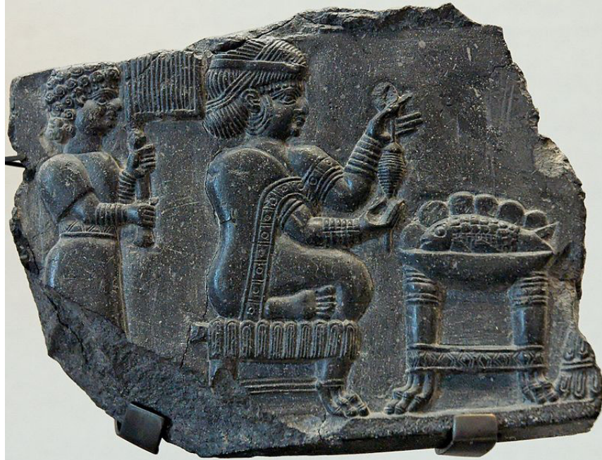
Jineka êlamî teşiyê dirêse û li pêşiya wê amanek ku masî têda ye heye

Dîrokzan William Durant gotiye ku "gelê Êlam yek ji şaristaniyên pêşîn û here naskirî di dîroka cîhanê da pêkaniye. Zaniyarên Arkêologiyê yên Fransiyan di herêmên Êlamiyan da pir şopên mirovî dîtine ku dema wan vedigere bîst hezar sal. Herweha belgeyên wisa dîtine ku pêkhatina şaristaniyeka pir pêşketî piştrast dikin ku dema wê vedigere sala 4500 b.z. Li ba wan nivîsîna pîroz, belgeyên bazirganî, neynik, berdilk û gerdenên jinan hebûne, û bazirganiyeka ku ji Misirê heya bi Hindê pêkdihat hebû. Em li ba wan ... guldankên bi temamî gilover û xweşik hatine duristkirin dibînin, li ser wan bi hunerî hin dirûvên endesyarî, wêneyên spehî û rindik ku lawir, kulîlk û daran dinimînin hene" 9 .