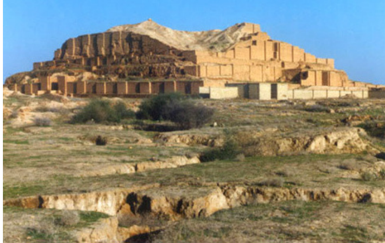
Zaqora (perestgeh) êlamî

Dîrokzan William Durant gotiye ku "gelê Êlam yek ji şaristaniyên pêşîn û here naskirî di dîroka cîhanê da pêkaniye. Zaniyarên Arkêologiyê yên Fransiyan di herêmên Êlamiyan da pir şopên mirovî dîtine ku dema wan vedigere bîst hezar sal. Herweha belgeyên wisa dîtine ku pêkhatina şaristaniyeka pir pêşketî piştrast dikin ku dema wê vedigere sala 4500 b.z. Li ba wan nivîsîna pîroz, belgeyên bazirganî, neynik, berdilk û gerdenên jinan hebûne, û bazirganiyeka ku ji Misirê heya bi Hindê pêkdihat hebû. Em li ba wan ... guldankên bi temamî gilover û xweşik hatine duristkirin dibînin, li ser wan bi hunerî hin dirûvên endesyarî, wêneyên spehî û rindik ku lawir, kulîlk û daran dinimînin hene" 9 .