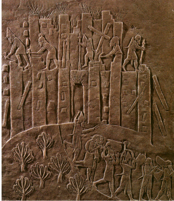
Leşkerê Aşûr bi rêveberiya Aşûrbanîpal bi darê zorê dikevin Sûsa

Aşûrbanîpal ev sezayê mezin da Êlamiyan ji ber berxwedana wan û qehremaniya wan di şer da û ji ber zererên mezin ku wan gihande hêzên Aşûriyan . Aşûrbanîpal lekên leşkerî yên êlamî ji wir rakirin û teve hêzên xwe yên leşkerî kirin, da ku wan ji bo xwe di şerên Aşûriyan da li dijî padîşahiya din bi karbîne. Ev jî belegeya wê yekê ye ku hêzên Êlamiyan di şer da pir navdar bûn. Bi vê kiryarê xwast ku rê li ber wê yekê bibire ku ji pêra ti serleşkerekî êlamî hewl nede hêzên Êlaman bicivîne û li dijî Aşûriyan berxwedanê bike 6 .