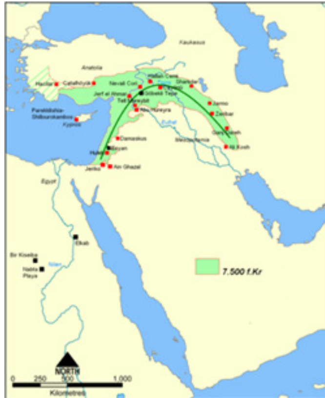
(Herêma Heyva Berhemdar pêş 7500 b.z)