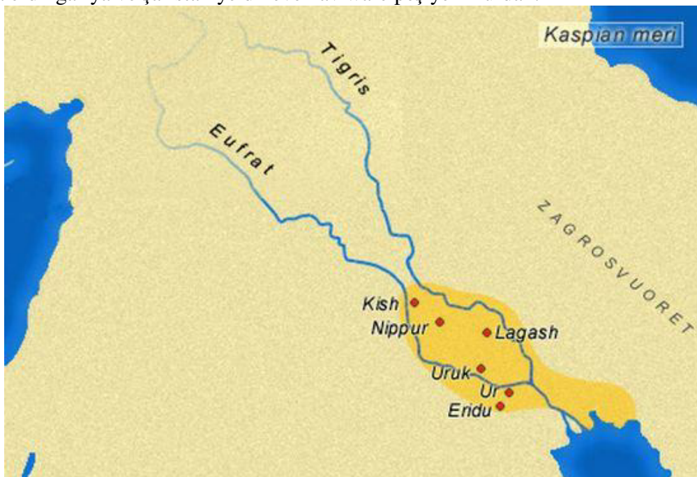
(Sûmer û çiyayên Zagros)

Mebest bi " Helefiyan " rûniştivanên erdnîgariya " Şaristaniya Helef "-in. Bi me ra di babeta " Pêşiyên Kurdan û gînen şaristaniya Guzana " derbas bû ku peyva " Helef " li gor " Til-Helef " hatiye binavkirin û ev nav ji navê " Girê Guzana " hatiye erebkirin; ew li aliyê rastê yê çemê Xabûr, li başûrê Serê Kaniyê yê rojavayê Kurdistanê dikeve. Dîsa bi me ra derbas bû ku piraniya erdnîgariya vê şaristaniyê dikeve nav warê pêşiyên Kurdan .