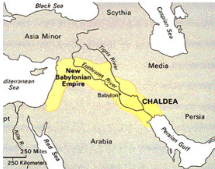
(padîsahiya Keldanan piştî 612-an b.z.)

naskirî di droka mirovatîyê da di hezarsala pêncan b.z. da li niştecihê Keldanên pêşîn peyda bûye; hên pêş ku Sûmerî bigihînin başûrê Mêzopotamiya bi dora 1500 sal. Ew Akkadiyan , Babiliyan , Aşûriyan û Suryanan hemîyan vedigerîne ser " Keldanên pêşîn " 6 .