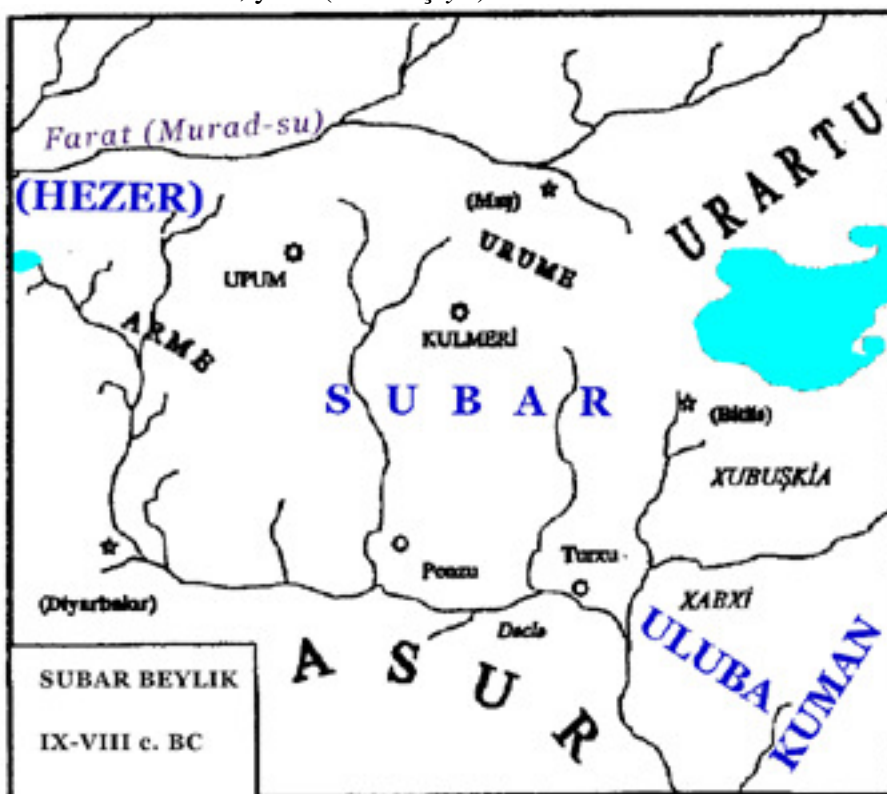
( Sûbartûya Nawendî )

Zorbeya erdnîgariya Sûbartû ya nawendî dikeve rojhilatê çemê Dijle, navbera çemê Zapê jorîn û Zapê jêrîn. Ew jî ew herêm bi xwe ye, ya ku paşê bi navê " welatê Aşûr " hate binavkirin. Erdnîgariya Sûbartû di nivîsên babilî da, di heyama padîşah Hammurapet (1792 - 1750 b.z.) da bi şêwazê " matum elitum ", yanê ( welatê jorîn ) hatiye. Piştî wê Farisan nav li vê herêmê kirine " Gohestan ", yanê ( welatê çiyayê ). Di jêderên erebî-îslamî da jêra gotine " Qohistan " û " Bilad El-Cebel ", yanê ( welatê çiya ) 6 .