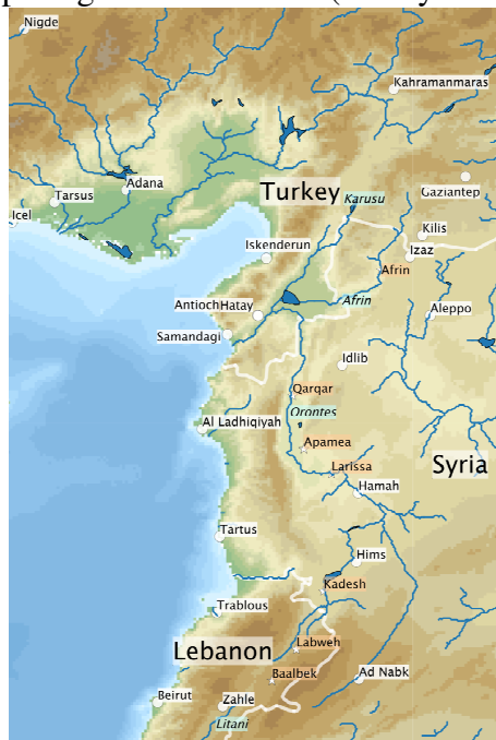
(Çemê Ûrûnt = Hûran = çemê Asê)

Duwem - navê çemê Asê Ûrûntes (Orontes): Ev çem ji komê çavkaniyan ji kantarên zincîra çiyayên Libnan yê rojava û zincîra çiyayên Libnan yê rojhilat pêktê. Ew dikeve Sûriyayê û berê xwe di deştên parêzgehên Hums û Hemayê ra dide bakur. Di pey ra ev çem deşta Hemqê (başûr-rojavayê deşta Cûmê li herêma Efrîn - rojavayê Kurdistanê) derbas dîke, bi çemê Efrîn ra ku ji rojhilat da tê û bi Ava Reş ra ku ji bakur da tê dibe yek, û bi hev ra li hinda perava Suweydiyê li parêzgeha Îskenderûnê (Turkiya niha) dirijin Derya Sipî.