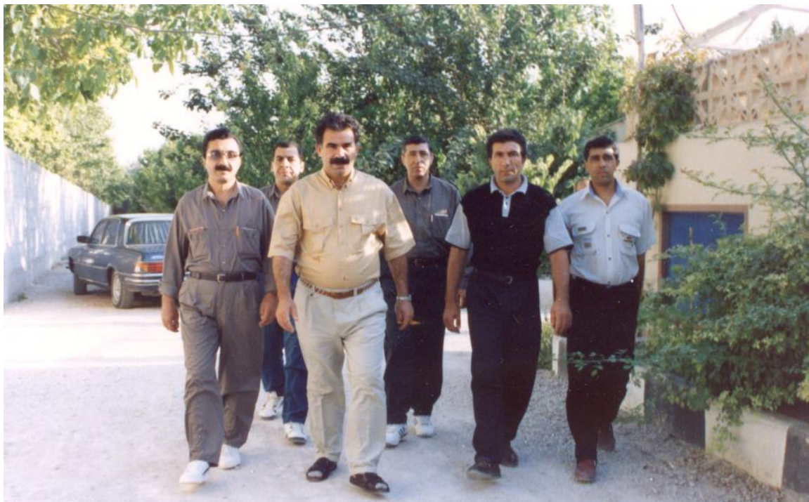
Bi serokê giştî yê PKK Abdullah Ocalan ra di hewşa Akadêmîyê da.

Rojhilata Navîn – herêma here germ a cîhana me. Li wir ji serdemên kevnartirîn va berjewendîyên gelên cuda raserî hev hatine, ewê pêkhatin û mirina gelek şaristanîyan dîtine.