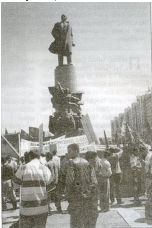
A, ya ku wisa Zavêlskî har kirye jî, ev e...!

– Ma, gelo di Kurdistanê da kes an rêxistinên wisa tunebûne, yên ku xwe firotime mêtîngeran? (Helbet, kes û rêxistinên wisa di hemû welatên mêtîngeh da hebûne!).